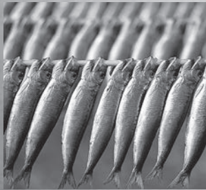
上：天日干し風景 左：丸干しイワシ