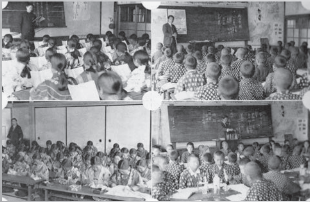
昭和13年(1938)の授業風景

昭和30年(1955)には三村合併による干潟町誕生を機に干潟町立西小学校と改称し、昭和47年(1972)には沖分校を統合して現在地に移転しました。平成17年(2005)には平成の大合併をうけて旭市立古城小学校と改称し現在に至っています。(干潟西小学校百年の歩みより)