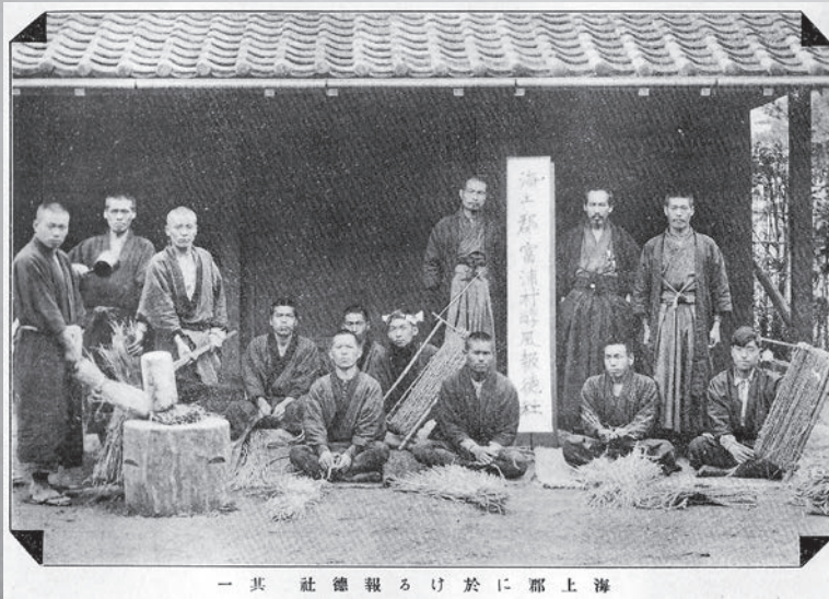
一 其 社 徳 報 け 於 に 郡 上 海