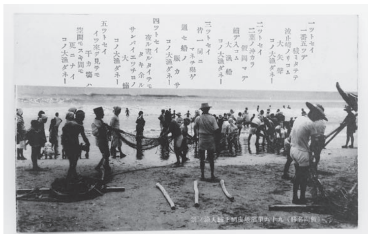
絵葉書 「九十九里浜飯岡名勝 九十九里濱 地曳網ト鰯人漁ノ景 昭和初期」