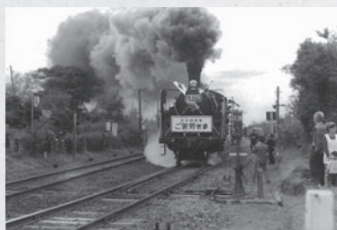
C5771の汽車の前に 「ご苦労さま」の標語