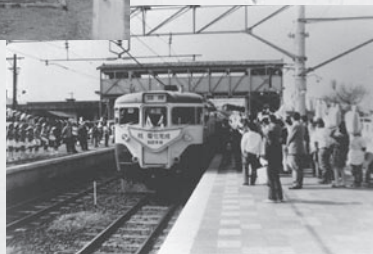
臨時列車の前に 「祝 電化完成」の標語

旭市文書館は、旭市民会館の2階にあります。多くの古文書と共に古い写真も収蔵しています。その中から蒸気機関車の写真を紹介します。