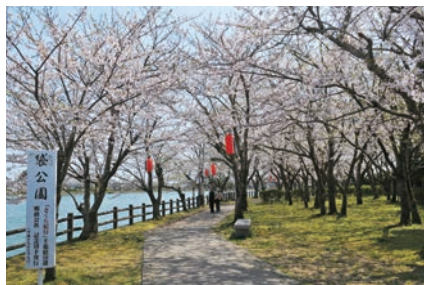
袋公園の満開の桜

今年も市内各所で桜が満開を迎えました。特に袋公園では、水面に写る花や舞い落ちる花びらが、幻想的な風景を作り出していました。